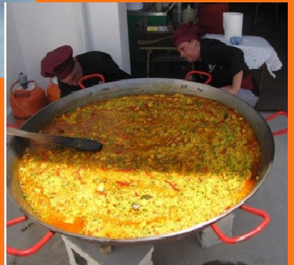
Mostră de gastronomie traditională iberică